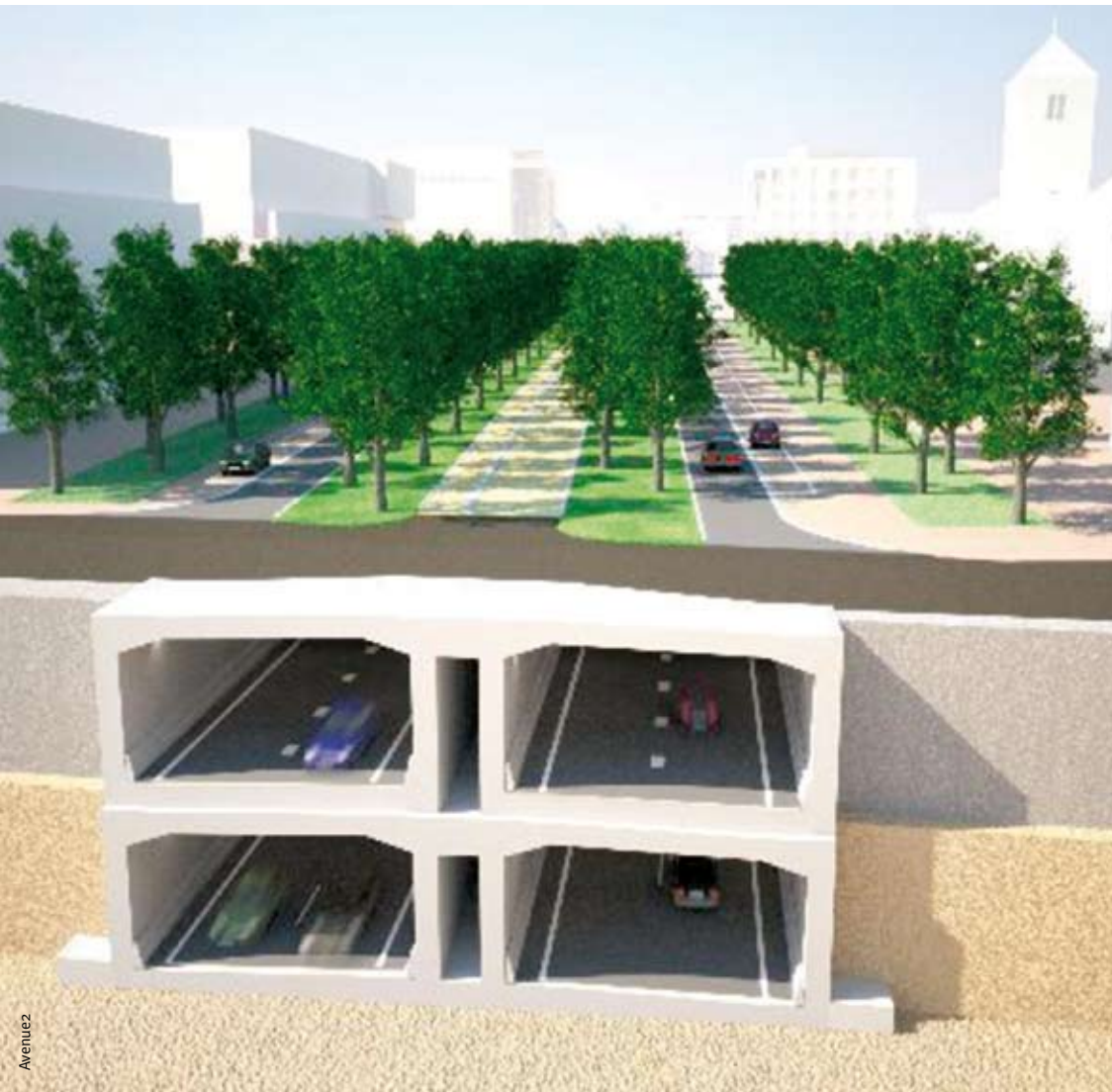
A2 tunnel Maastricht